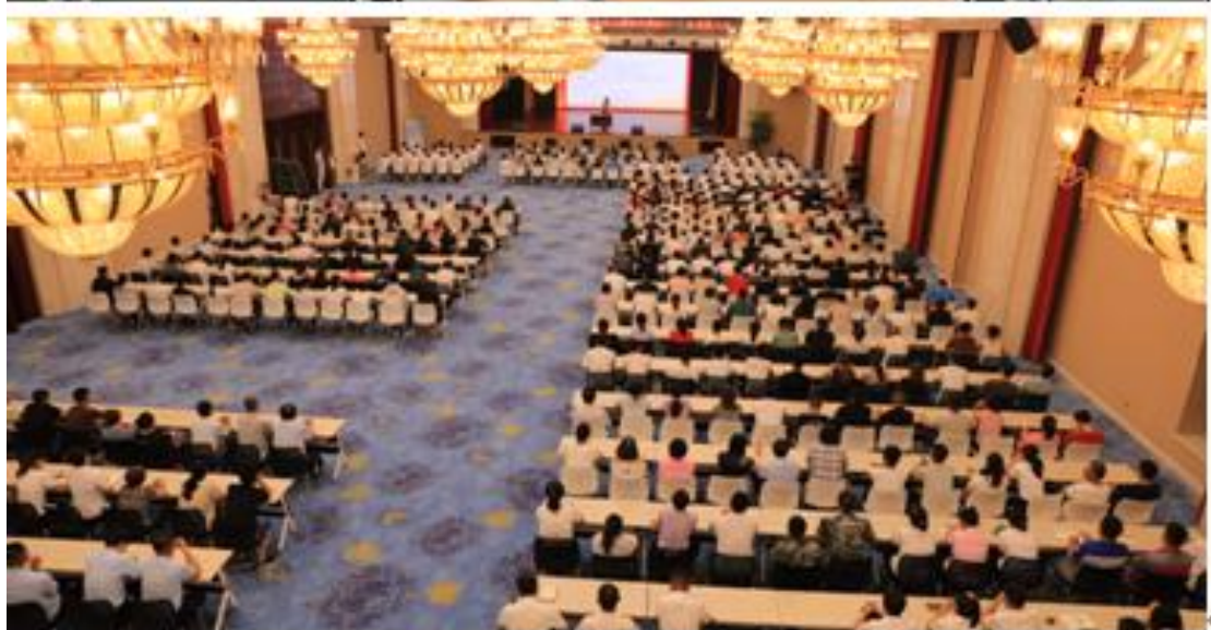
上图说明：2020 年，开展新时代文明实践社科普及专家团志愿服务